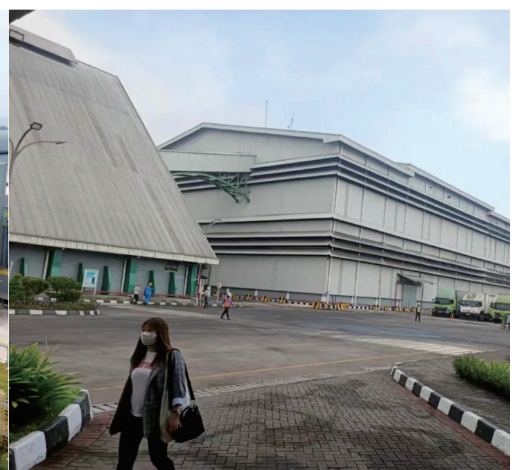
福克斯集團屬下的精煉糖廠一角。